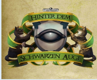
made with Auge by Hinter dem Schwarzen Auge!

https://gamefound.com/de/projects/ulisses-spiele/wolfsfrost