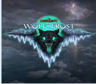
© 2024 Bild by Ulisses Spiele GmbH

Alle Links zum Projekt findest du hier (Klick):