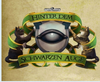
made with Auge by Hinter dem Schwarzen Auge!

https://gamefound.com/de/projects/ulisses-spiele/wolfsfrost